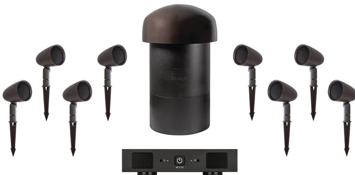
SGS systém SKU 93433

8 SGS SATELITŮ | 8 ZEMNÍCH KOLÍKŮ | 1 SGS SUBWOOFER | 1 ZESILOVAČ 2-125